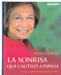
La sonrisa que cautivó a España Fermin J. Urbiola Libros Libres

Por Maite Herrero