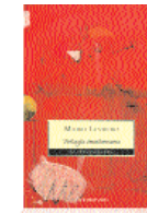
Trilogía involuntaria Mario Leverro DeBolsilo

De Brasil a Japón, de la antigua Roma a las pesadillas futuristas, los espectros continúan deambulando entre nosotros. Un fantasma recorre las páginas de este libro. ¿Qué forma adoptan los espectros? ¿De dónde viene la obsesión atávica por dejar constancia de sus apariciones en una infinidad de relatos y cuentos? El fantasma toca, pero no puede ser tocado y no deja de volver. Sus desafíos elementales a las leyes de la materia lo convierten en la figura central de la literatura fantástica.