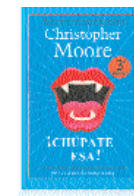
¡Chúpate esa! Christopher Moore Factoría de Ideas

La ciudad, París y El lugar son las tres primeras novelas de Mario Leverro y componen la que llamo Trilogía involuntaria , pues comparten, sin darse un plan inicial, cierta unidad temática e incluso topológica. Sus personajes pueblan escenarios sembrados de lastré y dilación, donde el sueño da paso a la amenaza, donde lo fantástico aparece entre las ruinas de lo real. La escritura de Leverro, articulada entre el humor y el desasosiego, se concreta en una prosa limpia, fundamentada en el psicológico, que ha sido definida como realismo introspectivo.