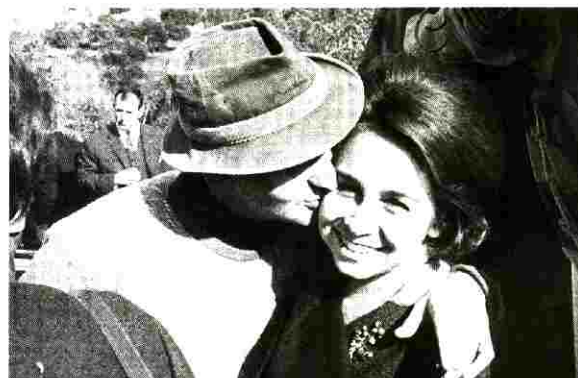
Don Juan Carlos besa a doña Sofía en una imagen inédita capturada durante una cacería.